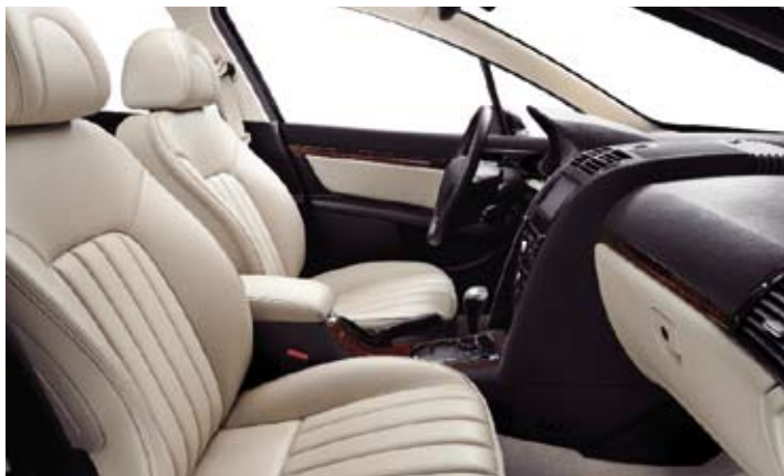
Koža Terre de Cassel*