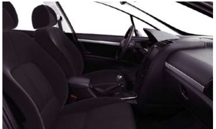
Tkanina sa dezenom Velouré Trad Tramontane