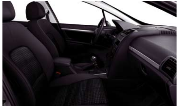
Tkanina i dezen Figure