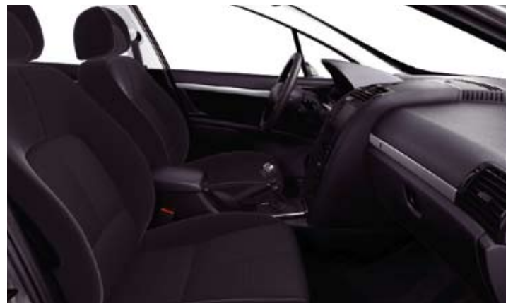
Tkanina sa dezenom Velouré Trad Tramontane