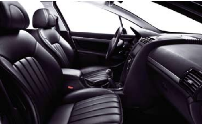
Crna koža Mistral*