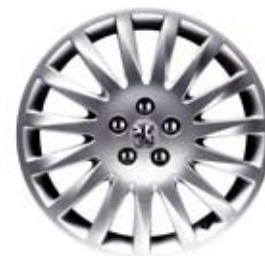
5. Aluminijumske felge Soleil 18 (1) (lanci za snijeg se ne mogu postaviti)