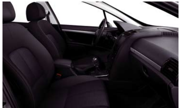
Tkanina Tressé Andorre Bleuté