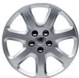
1. Naplaci Andante 16"