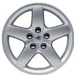
3. Aluminijumske felge Quasar 16" ili 17** (kod felgi 17" lanci za snijeg se mogu postaviti jedino pomoću sistema Centrax)