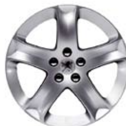
4. Aluminijumske felge Cosmos 17** (lanci za snijeg se mogu postaviti jedino pomoću sistema Centrax)