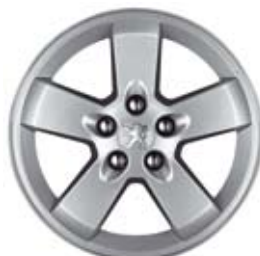
2. Felge Hortaz 16**