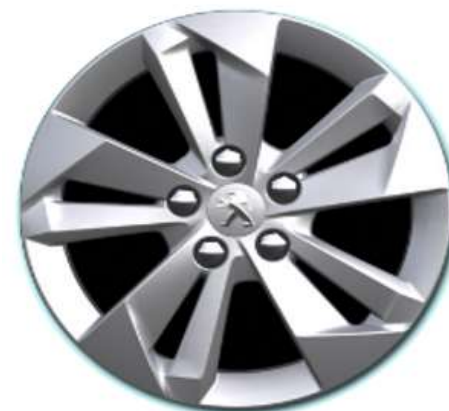
Opcijski na nivou opreme ALLURE 16" ALU felge 'TARANAKI'