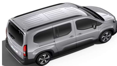
F4M0 - SIVA ARTENSE