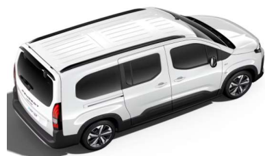
PRP0 - BIJELA ICY