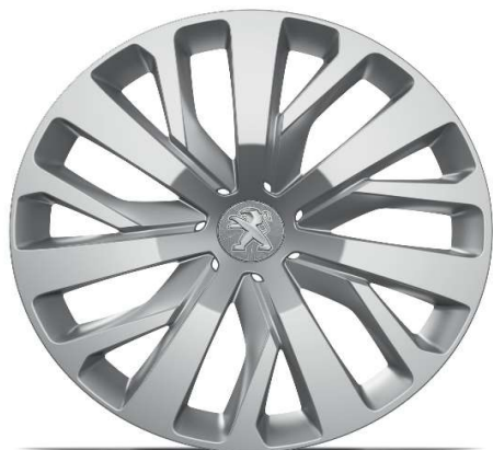
Serijski na nivou opreme ACTIVE PACK 16" čelične felge s ukrasnim poklopcem 'RAKIURA'