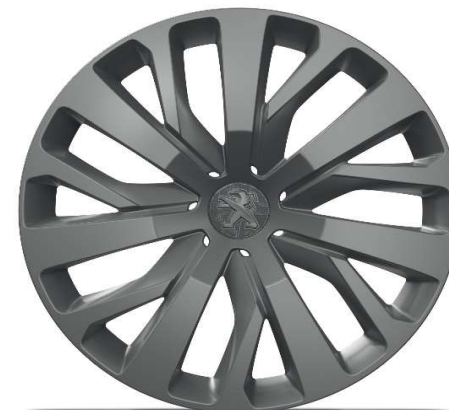
Serijski na nivou opreme ALLURE 16" čelične felge s ukrasnim poklopcem 'TONGARIRO'