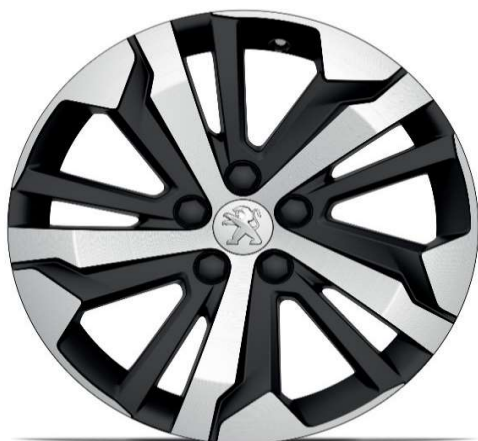
Serijski na nivou opreme GT 17" ALU felge 'AORAKI'