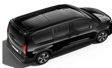
9VM0 - CRNA PERLA NERA