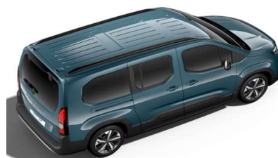
M6M0 - PLAVA LIBECCIO