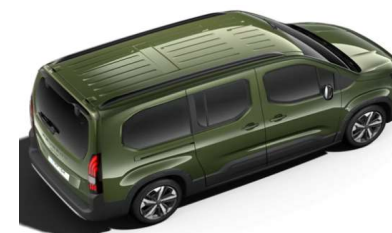
4QM0 - ZELENA KHAKI